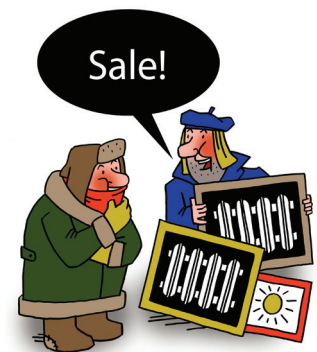
távhő karikatúra (Gennadiy Nazarov, Ukrajna)

Javasoljuk, hogy fizetési nehézség esetén mielőbb keresse fel ügyfélszolgálatunkat, ahol számlaegyeztetést követően, a fizetési készség bizonyítása mellett részletfizetési megállapodást köthet. Amennyiben a fizetési felszólításunkra nem reagál, az együttműködés hiánya miatt az eljárás jogi útra terelődik, és a jogi eljárás során felmerült összes járulékos költség is a díjfizetőt terheli a tőketartozáson és a késedelmi kamaton túl.